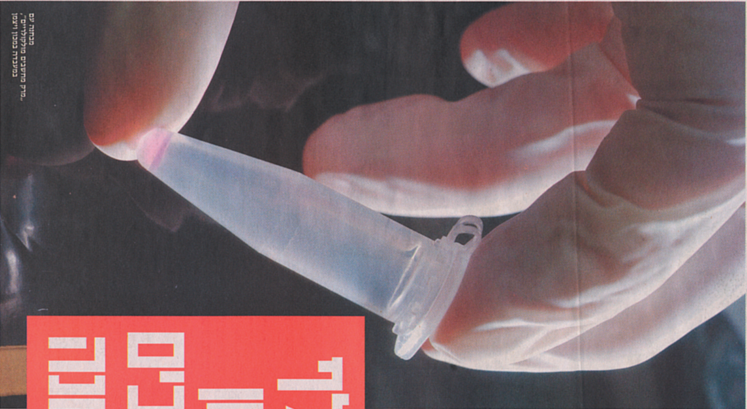
מסגרת: רוביט לרנסט "מיניקולוס פוטנטים ג'מ" בתוך: רוביט