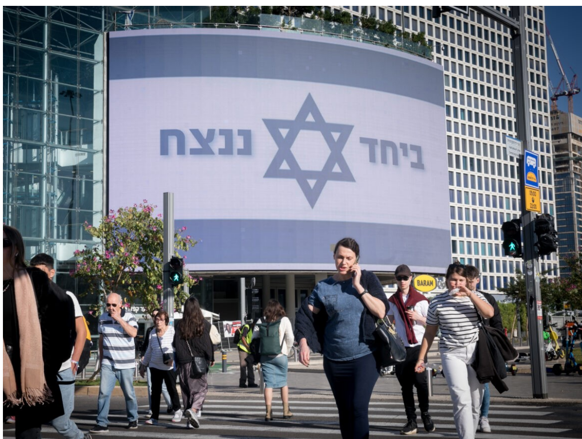
חבל הצלה לימין. שלט "ביחד ננצח" בעזריאלי בתל אביב, ב-19 בדצמבר 2023

האחדות שנוצרה לכאורה בשדה הקרב בעזה דיללה מאוד את גל המחאה העצום ששטף את ישראל באוקטובר. יותר מכך, עצם המחאה בקפלן, וקודם לכן בבלפור, הוצגה כמעשה מפלג. "לא לתת לקול והמפלגים להחזיר אותנו ל-6 באוקטובר", הסביר דוד שה, ממייסדי תנועת "תיקון 2024", שלדבריו ה באופן קבוע במחאה נגד ההפיכה המשטרית. העובדה שלמרות שיעורי התמיכה הנמוכים בבנימין נת המחאה מתקשה להוציא המונים לרחובות, נעוצה בשיח ה"ביחד ננצח" הזה. הימין, שמחאת קפלן ר האיום הכי בולט על ההגמוניה שהוא נהנה ממנה ב-20 השנים האחרונות, רואה בצדק את ה"ביחד ו כחבל הצלה שנפל לידינו בשעתו הקשה.