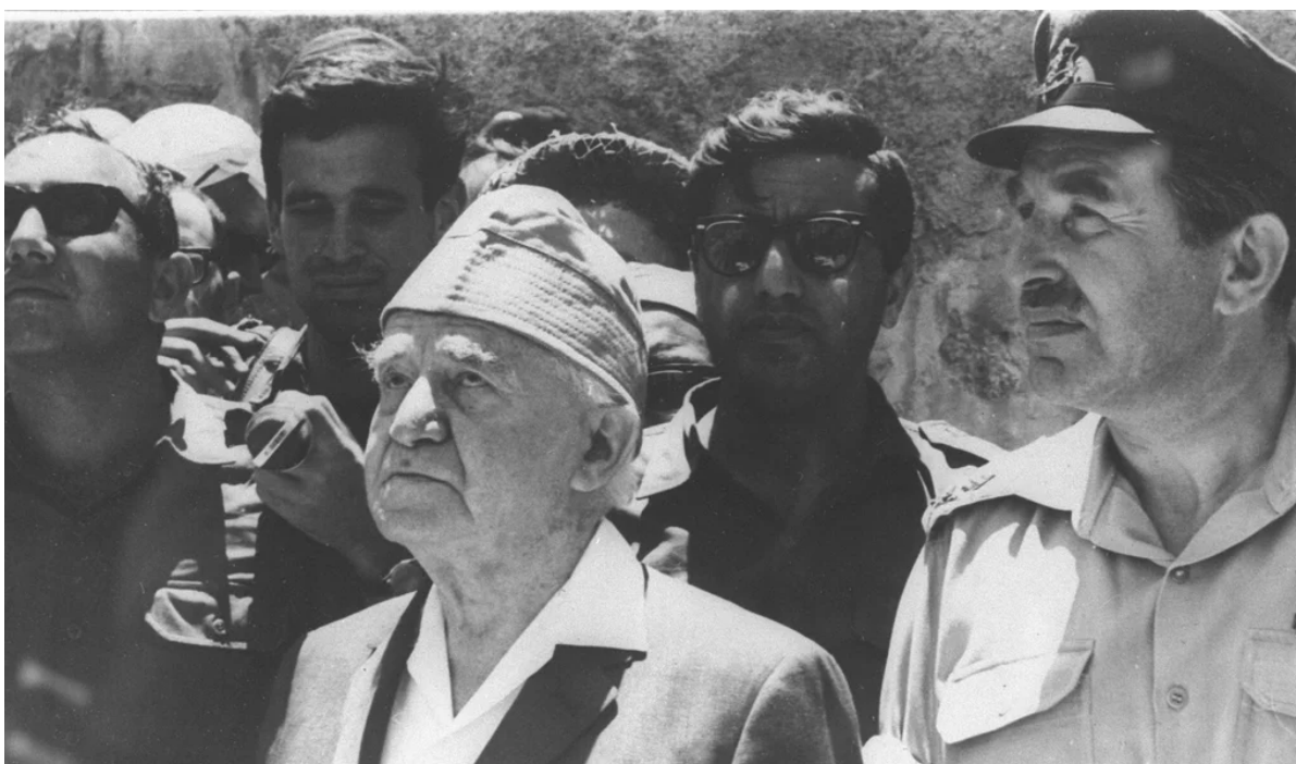
אלוף חיים הרצוג לצד ודוד בן גוריון מול הכותל המערבי, 1967. במנשר של הרצוג, שהופץ בערים הפלסטיניות ב-7.6.1967 נכתב כי כל סמכות שלטונית "תהא מעתה נתונה בידי בלבד"