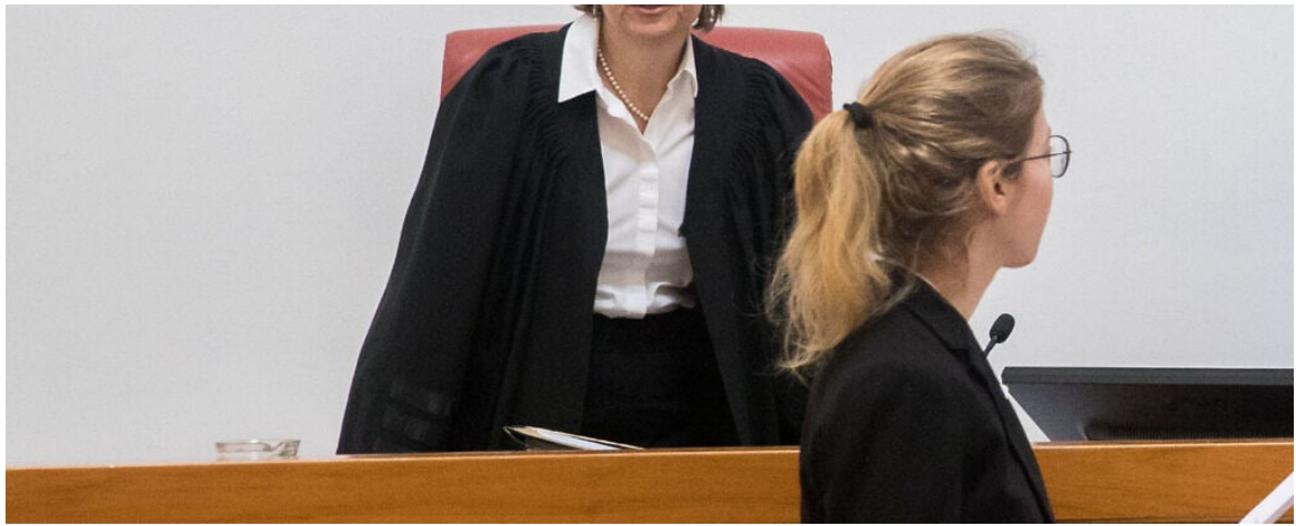
שופטת בית המשפט העליון יעל וילנר