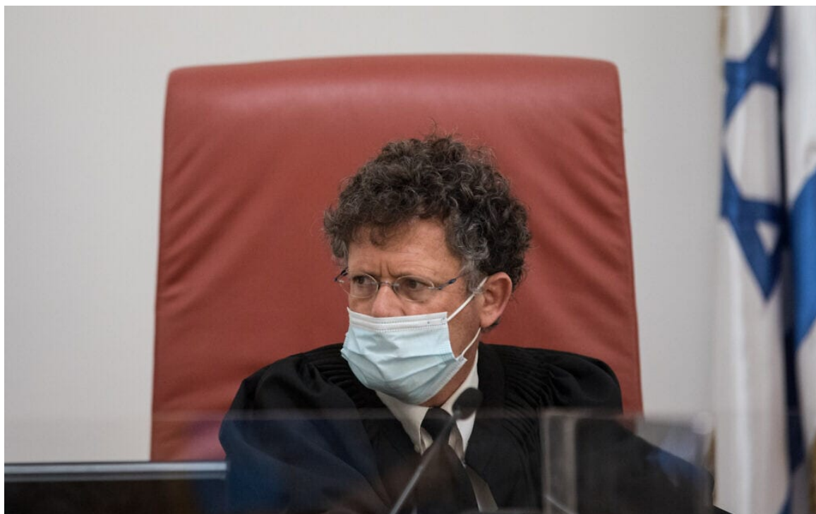
שופט בית המשפט העליון יצחק עמית

לעומת עמית הליברל המתון, מנהיג סולברג – בעצימות הולכת וגוברת – את הפלג האולטרה-שמרני של בית המשפט, והשופטת וילנר נמצאת, פחות או יותר, במחנה שלו.