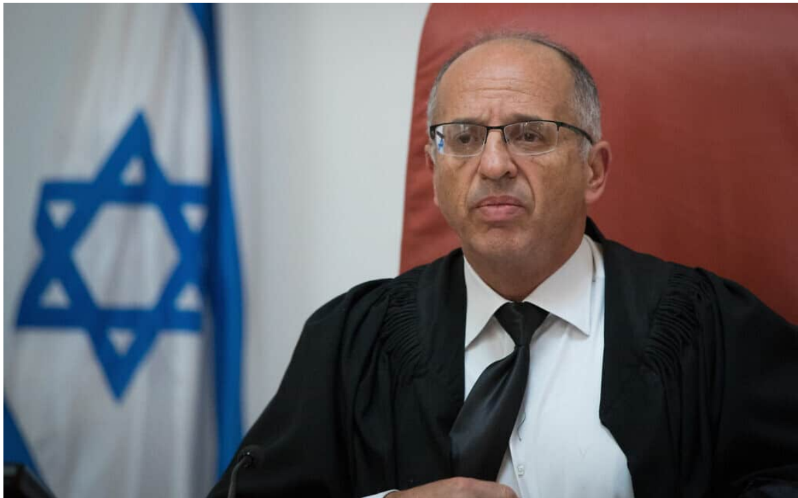
שופט בית המשפט העליון נעם סולברג

במקרה ההוא בית המשפט לא הצהיר בעצמו שכהונתו של דרעי הסתיימה, אלא עשה שימוש במנגנון שבו "סמכות שבשיקול דעת הופכת לסמכות שבחובה". שמגר כתב אז: "דעתי היא כי יש להצהיר שמן הדין שראש הממשלה יפעיל סמכותו לפי חוק יסוד הממשלה ויעביר את השר דרעי מכהונתו".