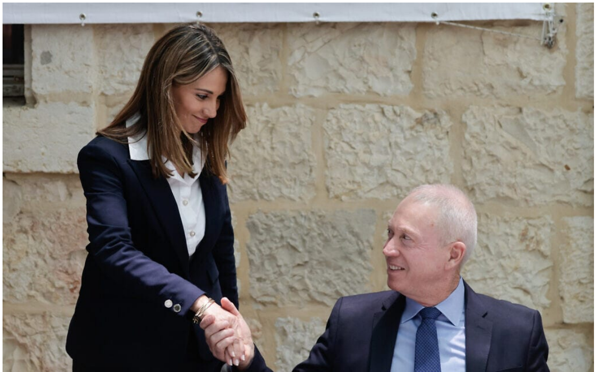
שרת החינוך יפעת שאשא ביטון ושר החינוך היוצא יואב גלנט בטקס חילופי השרים

מדובר באקדמאי, מדען מוביל בתחומו, שאיננו אישיות פוליטית ובחבטות שאנשים פוליטיים דוגמת גלנט חובטים בו פומבית , יש ממד של סאדיזם.