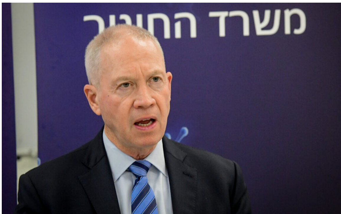
שר חינוך יואב גלנט

מנדלבליט, בעוד מופע של התבטלות בפני גורמים פוליטיים, הודיע לבג"ץ כי אמנם בהצטרפותו של גולדרייך לעצומות בעבר אין כדי למנוע ממנו לקבל את הפרס, אך החתימה האחרונה, שהגיעה לידיעת השר "רק השבוע", מעוררת חשש להפרה של הוראות חוק החרם. מדובר בקריאה לאיחוד האירופי להפסיק כל שיתוף פעולה עם אוניברסיטת אריאל.