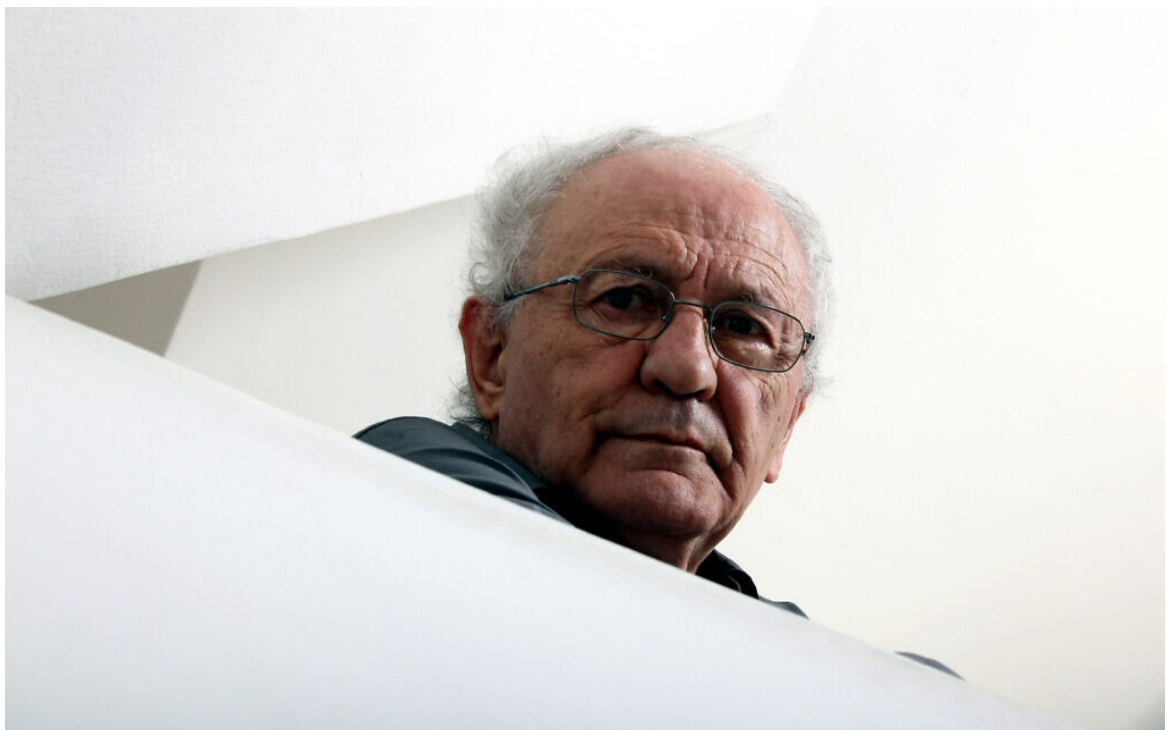
פרופ' זאב שטרנהל

"קשה שלא לראות את מניעת הפרס ממי שנמצא ראוי לו בשל הישגיו המקצועיים, אך על בסיס עמדות שהביע, כפגיעה בחופש הביטוי", כתבה השופטת עדנה ארבל בפסק הדין שדחה את העתירה .