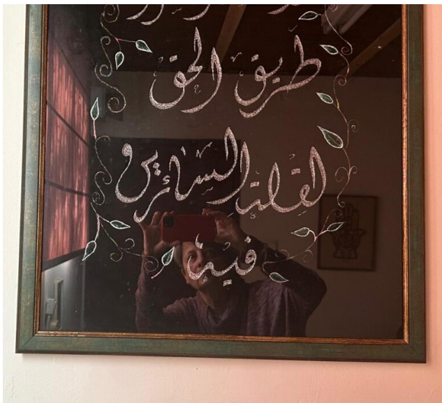
"אל תיואשו מדרך האמת, גם אם מעטים ההולכים בה". התמונה בחדר העבודה

מאבק ציבורי עיקש, הסכים הנשיא פרס לקצוב את עונשו, ואת עונשם של אסירים פלסטינים נוספים אזרחי ישראל שהואשמו ברצח חיילים. העונש הועמד אז על 37 שנים. חמש שנים לאחר מכן הורשע וליד דקה שוב, הפעם בשל חלקו בפרשת הברחת טלפונים לכלא. נגזרו עליו שתי שנות מאסר נוספות. במהלך השנים, הגיש וליד בקשות שונות לחנינה, לקציבת עונשו ולקיצור עונשו, ולבסוף גם לשחרור על בסיס הומניטרי, כשחות הדעת של רופאיו ניבאו שלא נותרו לו יותר משנתיים לחיות. כל הבקשות הללו נדחו. וכך, ללא טיפול רפואי מספק ובמנותק מבני משפחתו, הוא נפטר השבוע, לאחר ריצוי מאסר העולם ושנה מתוך השנתיים האמורות. על דבר אשפוזו ומותו נודע למשפחתו רק מהרשתות החברתיות. איש, לא מטעם שב"ס ולא מטעם בית החולים, לא טרח להודיעם. סוכת האבלים שהוקמה בביתו פורקה באלימות על ידי המשטרה, וגופתו מוחזקת עדיין ואינה משוחררת לקבורה.